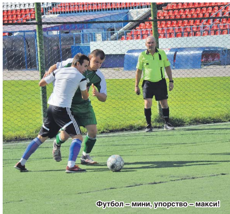
Футбол – мини, упорство – макси!