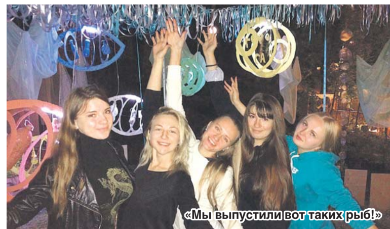
«Мы выпустили вот таких рыб!»

Награда вдохновила конкурсанток на новые идеи и проекты. И они очень надеются на то, что в следующем году не только они, но и другие студенты нашего университета представят на фестивале свои творческие работы. Это очень полезный опыт и возможность получить новые знания и навыки.